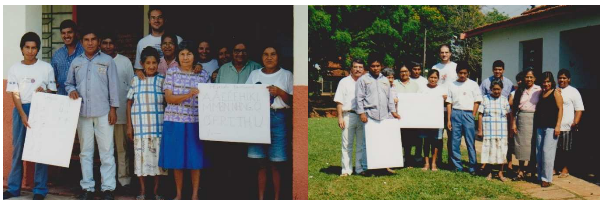
Imagens da I Convenção Ortográfica do Kaingang Paulista. T.I. Vanuíre, outubro 2000.